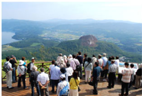
洞爺湖展望台より