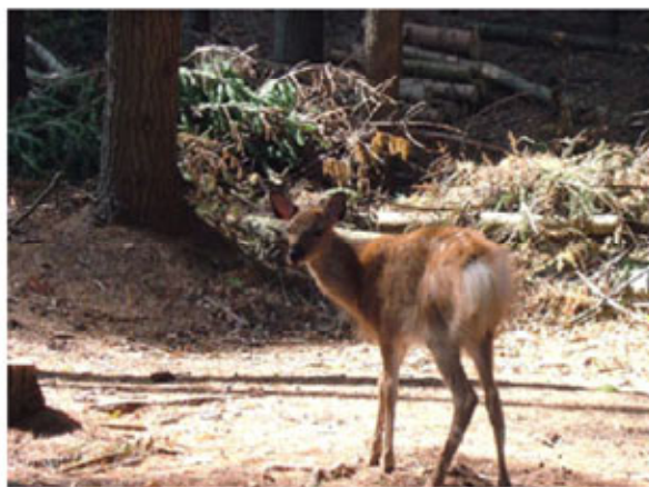
エゾシカとの出会い