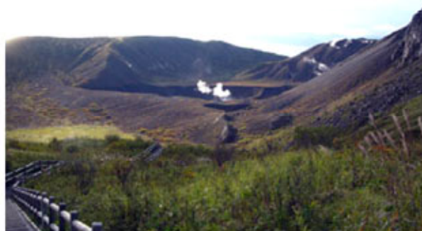
火口原展望台より銀沼火口が見えます